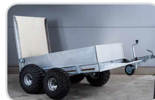
Balónové kolesá 2-nápravové (kolísavé) € 900,-