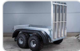
Zadné otváracie čelo nájazdové

Výška 350 mm € 660,- Výška 550 mm € 930,- Výška 750 mm € 1 200,-