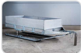
Hliníkové steny 4x

Výška 350 mm € 400,- Výška 550 mm € 450,- Výška 750 mm € 460,-