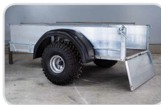
Zadné otváracie čelo

Výška 370 mm € 420,- Výška 570 mm € 490,-