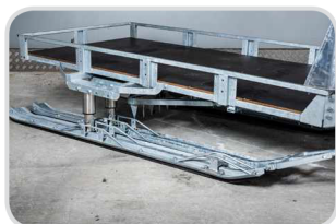
Rozšírenie na 2 lyže € 390,-