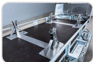
Nerezová nadstavba na prevoz ranených vrátane FERNO-nosítka € 2 115,-

(Samostatná kabeláž s ovládačom € 480,-)