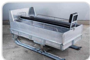
Úprava na prepravu osôb € 640,-

lavica stredová so zadnou opierkou, držiak vpredu, držiačky bočné