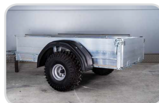
Blatník plastový 1-os € 145,-