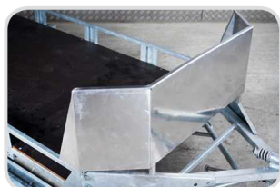
Hliníková ochrana predná € 300,-