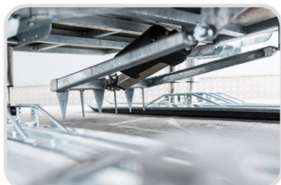
Prídavná brzda s ovládaním na ťažnom vozidle (inkl. kabeláž) € 2 450,-

(Samostatná kabeláž s ovládačom € 480,-)