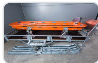
Nosítko FERNO F71 jednodielne € 900,-