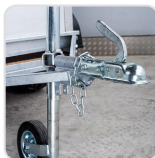
Žehlička (namiesto oka) € 140,-