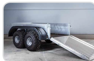
Blatník plastový 2-os € 240,-

lavica stredová so zadnou opierkou, držiak vpredu, držiačky bočné