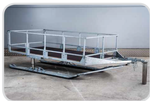
Joklová nadstavba pozinkovaná

Výška 370 mm € 420,- Výška 570 mm € 490,-