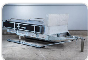
Bočná lavica odklápacia € 955,- (len pri lyžiach)

Jednoduchý skladačkový systém umožňuje nakonfigurovanie ľubovoľnej alternatívy saní. Zhotovenie akejkoľvek špeciálnej úpravy na zákazku. Opýtajte sa nás na možnosti.