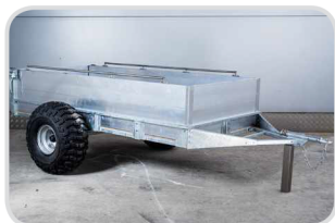
Reling / gurtňové úchyty € 200,-